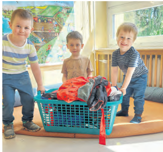
Mit großer Vorfreude und einem Korb voller Puppensachen und Kostüme erwarten die Kinder die Waschmaschinenmonteure

In der Kita ist es so ähnlich wie zu Hause, wenn plötzlich und unerwartet teure Haushalts- und Elektrogeräte kaputt gehen: es reißt ein unschönes Loch in den Haushaltsplan! Wie ist dieses Loch jedoch dann schnell wieder zu stopfen? Ende des Jahres 2023 ging die Waschmaschine in unserer Kita kaputt. Sie wurde fast täglich für Lätzchen, Decken, Kostüme, Puppensachen und Wechselsachen gebraucht. Die verfügbaren finanziellen Mittel für 2023 waren bereits verplant und ausgegeben, der neue Haushaltsplan noch nicht erstellt und eine Reparatur nicht mehr möglich. Auch der Versuch, schnellen und preiswerten Ersatz zu bekommen, scheiterte. Also nahmen Eltern und Erzieherinnen die anfallende Wäsche zum Waschen mit nach Hause. An dieser Stelle vielen Dank für dieses Engagement und deren Hilfsbereitschaft! Da für diesen Zustand keine kurzfristige Lösung in Sicht war, haben Eltern die Initiative ergriffen und ortsansässige Unternehmen angesprochen und um Unterstützung gebeten. Im Namen aller Kinder, Eltern und ErzieherInnen danken wir ganz herzlich den Firmen Kran- und Aufzugservice GmbH Karsdorf, der Kfz-Werkstatt Braune GmbH, der Biber-Beton GmbH & Co.KG, der Fördertechnik Ulf Kecke GmbH, der Firma Köhler Montagen und Instandsetzungen GmbH und dem Friseursalon Felgner. Einige Firmen überraschten uns mit einem größeren Betrag, sodass eine neue Waschmaschine zügig gekauft und in Betrieb genommen werden konnte. Weitere Freudentänze führten die Kinder zum