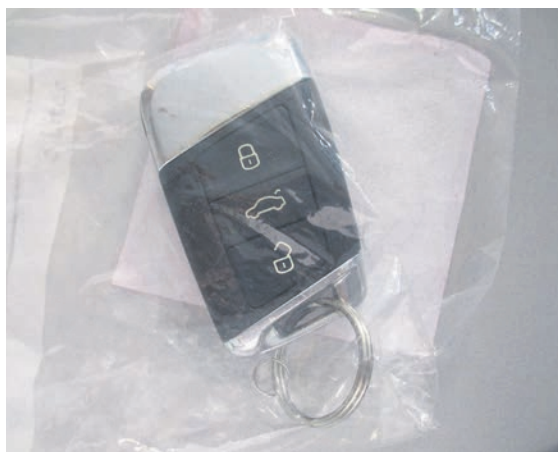
Fundort: Goseck OT Markröhlitz