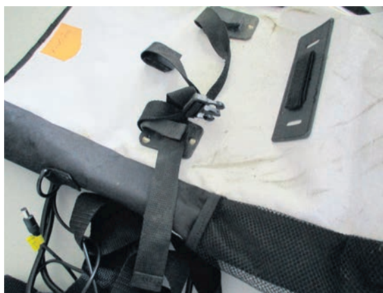
Fundort: Nebra (Unstrut)