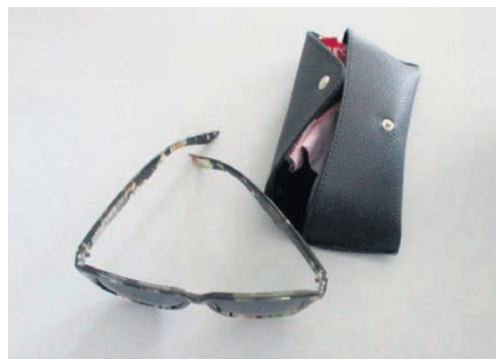
Fundort: Freyburg (Unstrut)