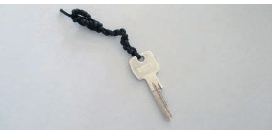
Fundort: Freyburg (Unstrut)

Sollten Sie ein verlorenes Utensil suchen, dann können Sie uns gerne unter folgender Telefonnummer kontaktieren: 034464/30038.