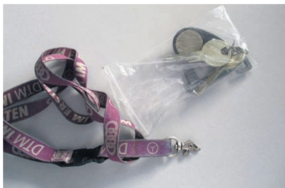
Fundort: Gleina OT Müncheroda